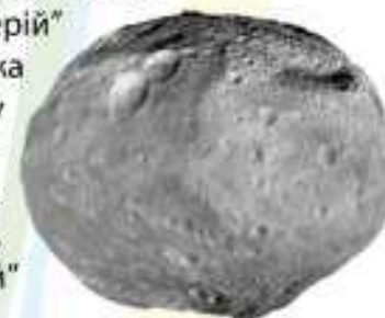
Цереру відкрили 1801 року, а Церій – 1803 року

Того ж року незалежно від них цей мінерал досліджував німецький вчений Мартін Клапрот. Йому також вдалося виділити Церій, ось тільки ця назва не припала йому до душі. На його думку, якщо вже пов'язувати його з Церерою, то метал мусить називатися Церерій, а назва „Церій” може призвести до плутанини, адже латиною вона схожа на „сега”, що позначає віск. Та Берцеліус не здавався: у своєму підручнику з хімії він зазначив, що слово „Церерій” складно вимовляти. В російській літературі на початку XIX століття Церій називали також Церь, Церін, Цер, Церіум. І лише в середині XIX століття назва „Церій” стала загальноприйнятною.